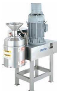
Procesador Comitrol® Modelo 1700 ofrece en el proceso valor agregado en la reducción de consumibles.

Ampliamente utilizado para cremas, complemento nutricional, alimentos para bebés, bebidas, y la industria para producir salsas; El principio de corte en el Comitrol, ha demostrado ser un novedoso proceso. Al ofrecer una amplia gama de tipos de cabezas de corte e impulsores intercambiables, el procesador Comitrol 1700, produce rebanadas, hojuelas, tiras, productos viscosos, o purés de innumerables frutas y vegetales.